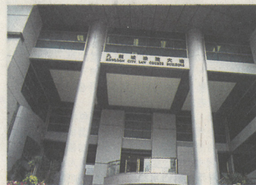
■非禮兩男童案昨於九龍城法院提堂。