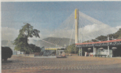
圖中一次非禮地點是青嶼幹線觀景台靜靜處。

幹線觀景台非禮她X，另於2016年至去年3月八次非禮姊妹Y，其中五次是在前車停在明愛醫院外發生，另一次在長沙灣維林街，餘下一次發生於巴士上。姊妹去年暑假報警，被告去年7月辭去教職。